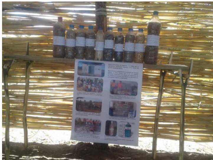
O Sistema de Banco de Sementes sobre as novas técnicas, usando bidons de água reciclados