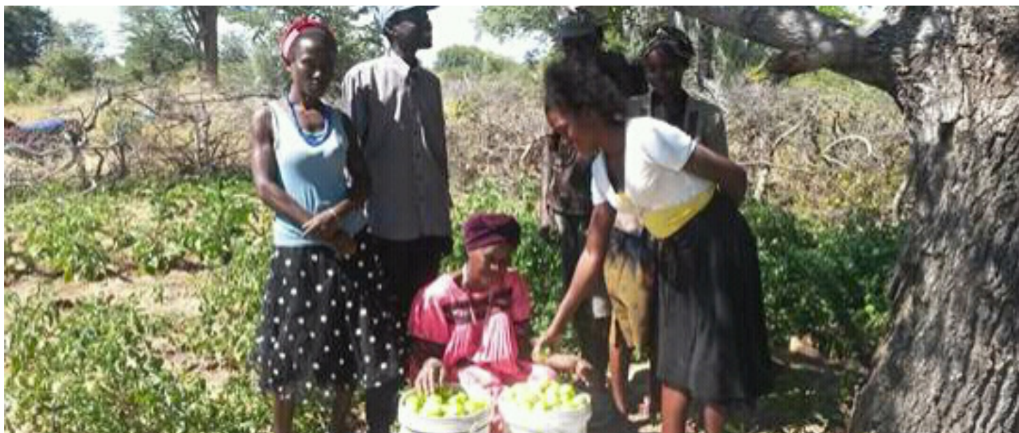
Os membros do Grupo de Acção, durante a colheita do tomate produzido na horta de demonstração de Bulunganga