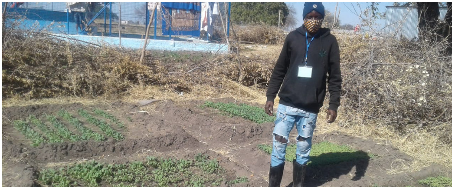
O Capacitador de Nehone, na hortas da Oficina próximo do Chafariz que se apoia para a irrigação da horta