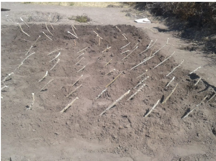
Demonstração da plantação de estacas da mandiocueiras na área de Okadweya.