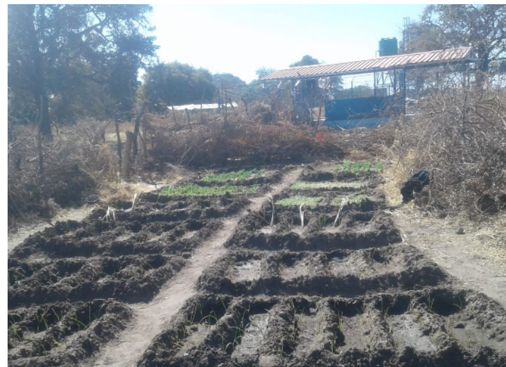
Canteiro de viveiro de couves, cebola na área de Okadweya