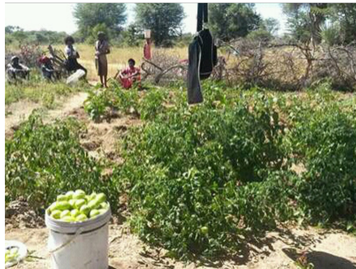
Os membros do Grupo de Acção na colheita de tomate, na Oficina do Bulunganga