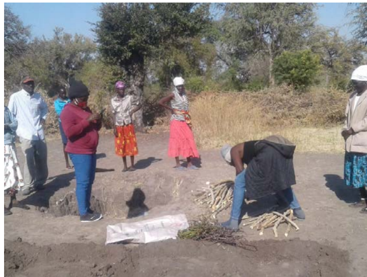
No espaço da Horta de Nehone, presentes os membros de GAC, Extensionistas da área, demonstração das estacas de Mandioqueira e ramas de Bata Doce, adequada para plantação.