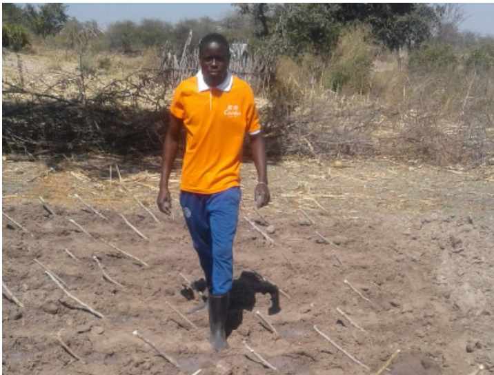
O Capacitador de Nehone, na área de demonstração sobre a plantação de mandioca