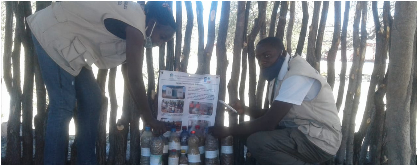
Na Oficina de Nehone, presentes os 2 Extensionistas da área, fazendo a demonstração do banco de sementes