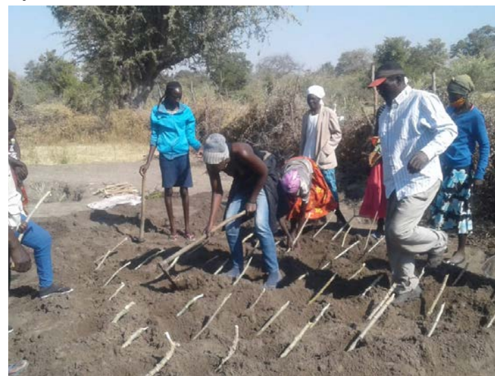
Cultivo de Mandioca na área de Okadweya, esteve presente o Grupo de Acção Comunitária, o Extensionista e o Capacitador