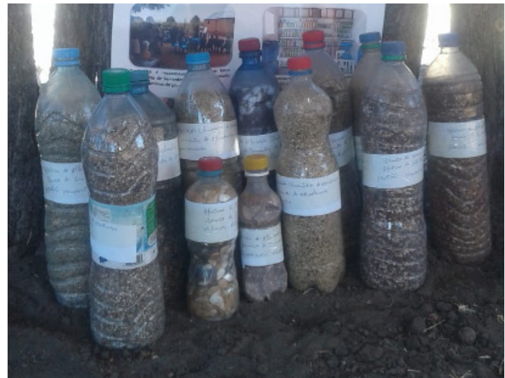
Demonstração do banco de sementes das variedades de: "Obieno" – grão parecido ao feijão macunde que também é um leguminoso, Massango, Massambala, Milho, Feijão macunde, sementes de Abóbora e sementes de Bóbras