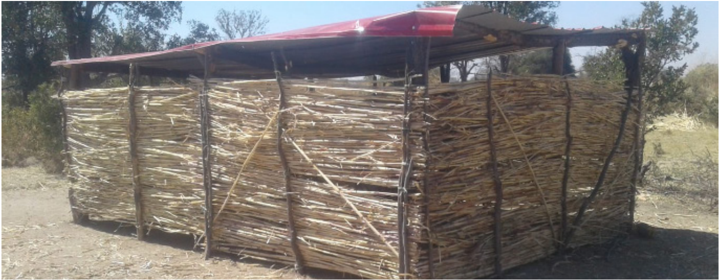
Representação da estrutura física da Oficina de Omukua