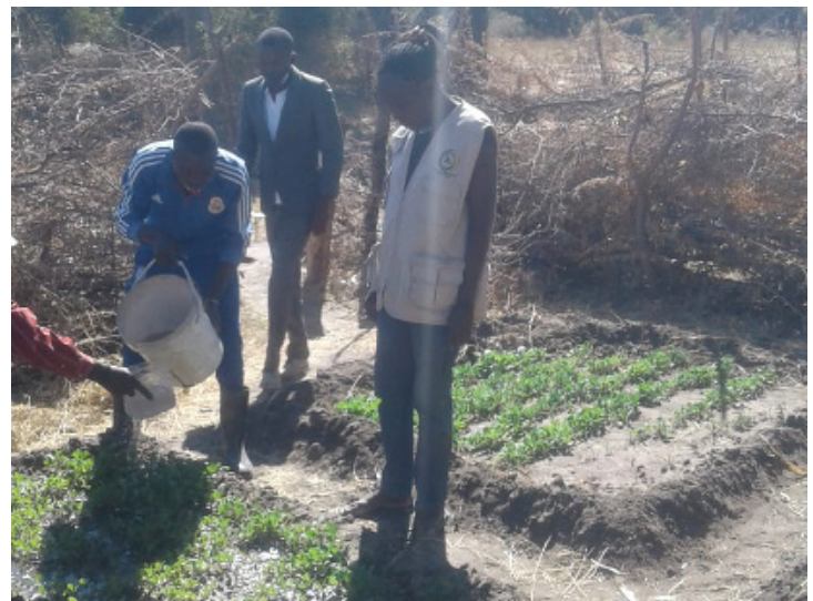
Extensionistas e o Capacitador durante a irrigação da horta de demonstração, na área do Omukua