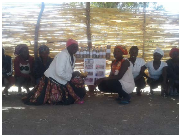
O Grupo de Acção Comunitária de Nehone, após completar a construção de Banco de Sementes de Massango, Mas-sambala, Milho, Feijão macunde, sementes de Abóbora, sementes de Bóbras adequadas ao tempo seco.