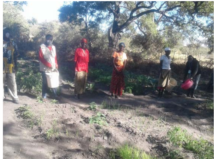
Grupo de Acção, durante a irrigação na horta da Oficina.