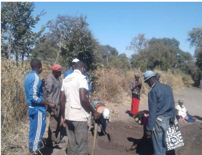
Grupo de Acção Comunitária em preparação de terreno para formação de canteiro